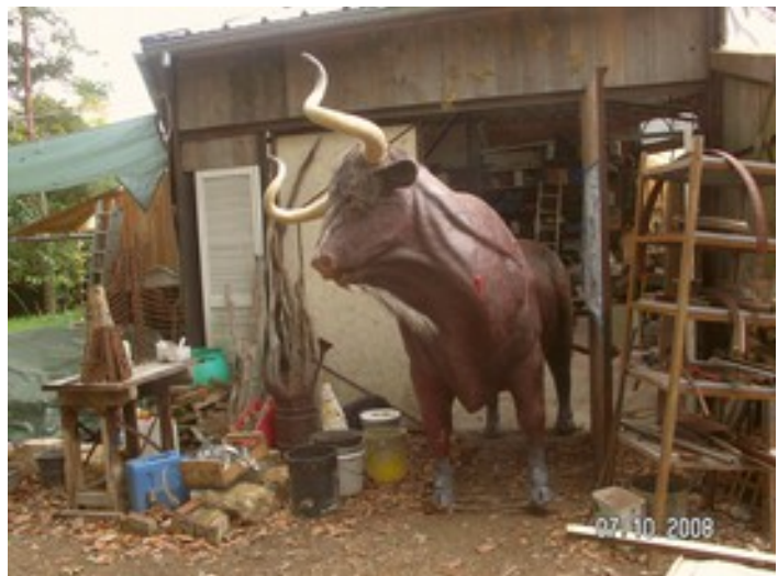
Modelage d'un enfant jouant de la flûte et réalisation d'un auroch en résine pour le Jardin de la Préhistoire d'Auneau.