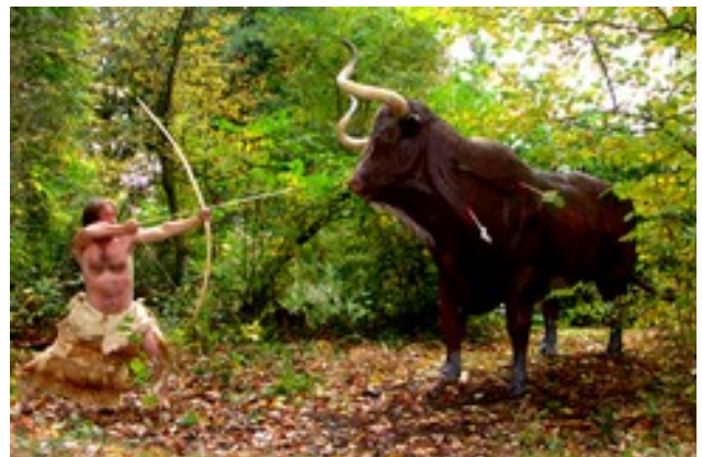
Scène de chasse à Auneau et délire de l'auteur.