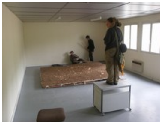
Moulage d'un amas de débitage, Bergeresse en Touraine-sud.