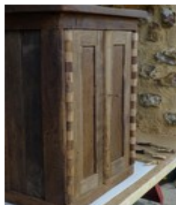
Maquette habitat néolithique et restitution d'une armoire III e siècle ap JC (place des Épars, Chartres)