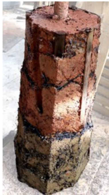
Installation de 5 "Repère" en bauge réalisés dans le cadre des Lettres de Pays par Les Fous de Bassans , théâtre de Beaugency