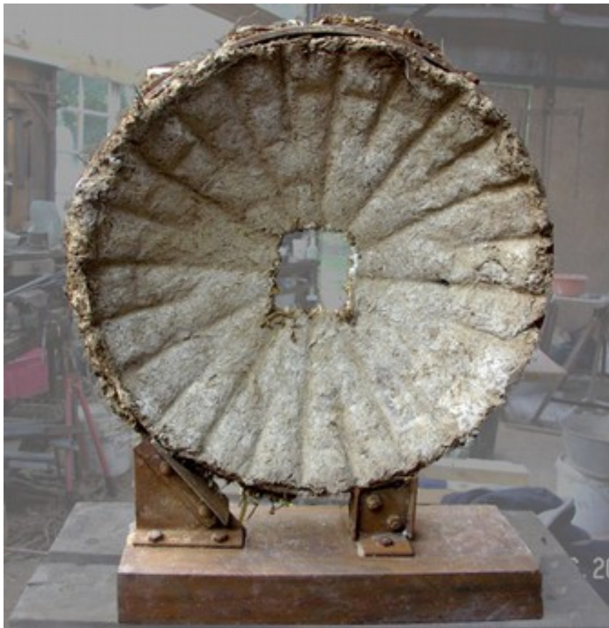
série d'une vingtaine de sculptures en bauge (terre crue avec paille)