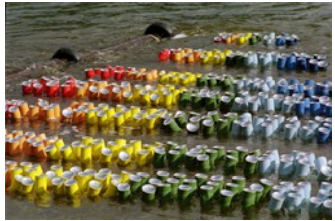
installation "Fleur d'eau" sur la Loire à Orléans