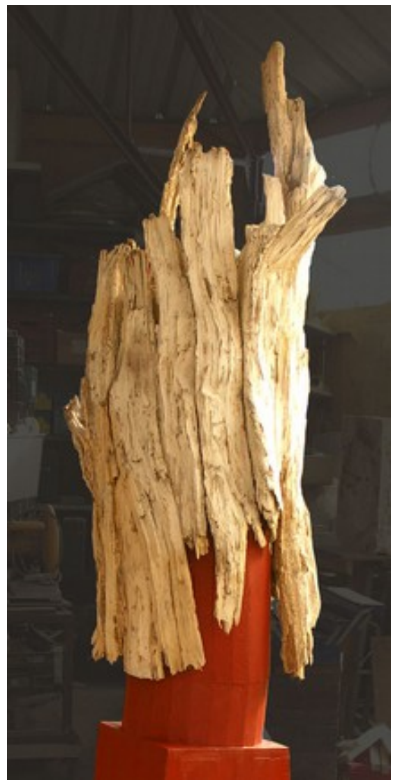
série de sculptures en bois suite aux dégâts d'une tempête près de mon atelier.