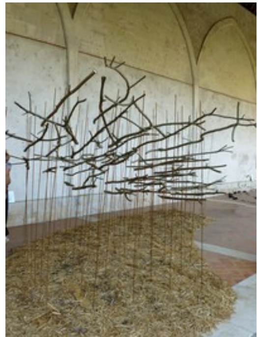
"Contre vents et marées" installation au Campo Santo à Orléans