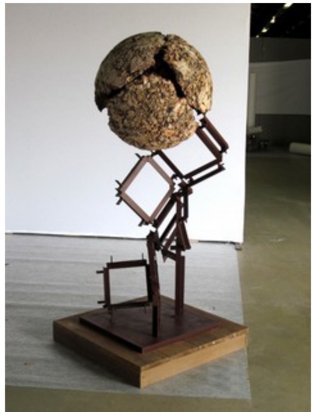
"Clair de ma Terre" et "cubanisation II" série de 3 sculptures sphériques en plâtre, béton et fer