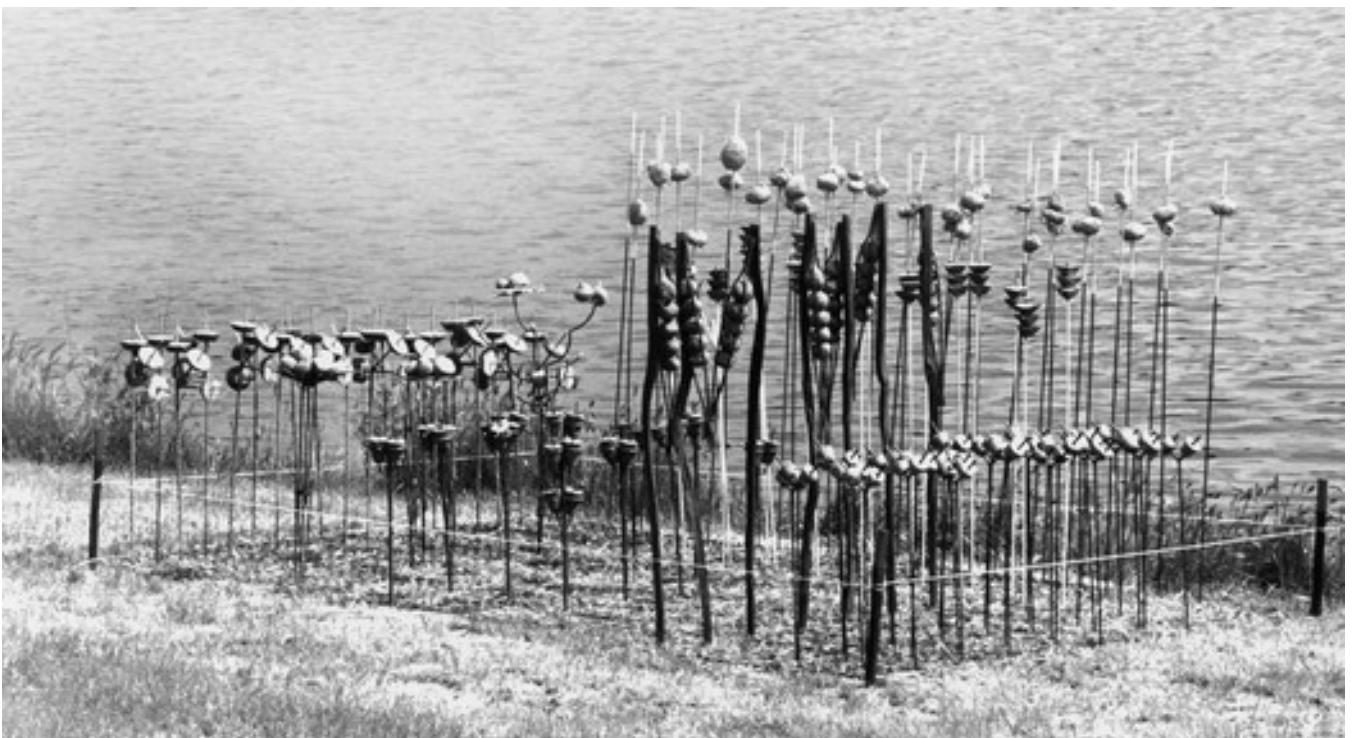
Installation « Opéra Garden Modulable » sur les bords de la Loire, Orléans

installation parrainée par l'association Label Friche